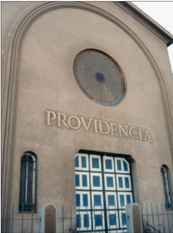
Iglesia ex Divina Providencia, II Región