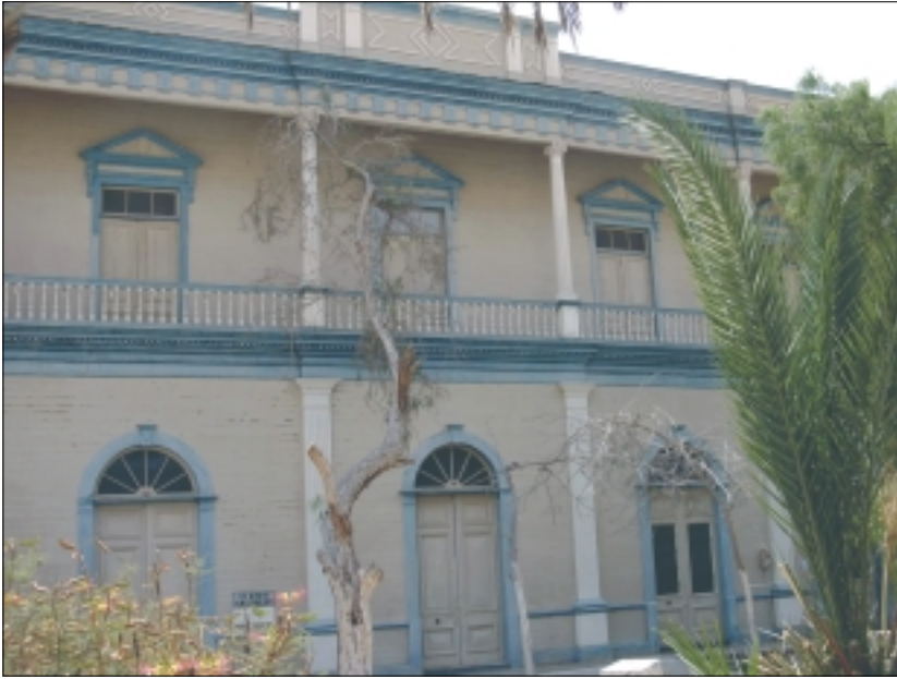
Pisagua, I Región